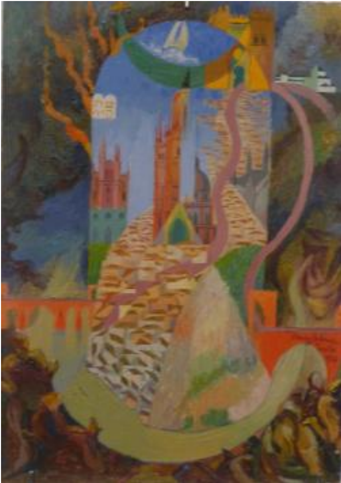
Henry Valensi , « Tolède ou l'Hommage au Greco », 1926, Coll. privée

Parallèlement, ses nombreux voyages en Europe et jusqu'au cœur du Sahara le conduisent à opérer des synthèses de l'histoire et de la géographie des villes, régions et territoires traversés. Si l'extrême complexité de l'immense toile Rome (1923) la rend peu accessible, l'« expression » picturale qu'il livre de la ville espagnole de Tolède dans la petite toile Tolède ou l'Hommage au Greco est éloquent.