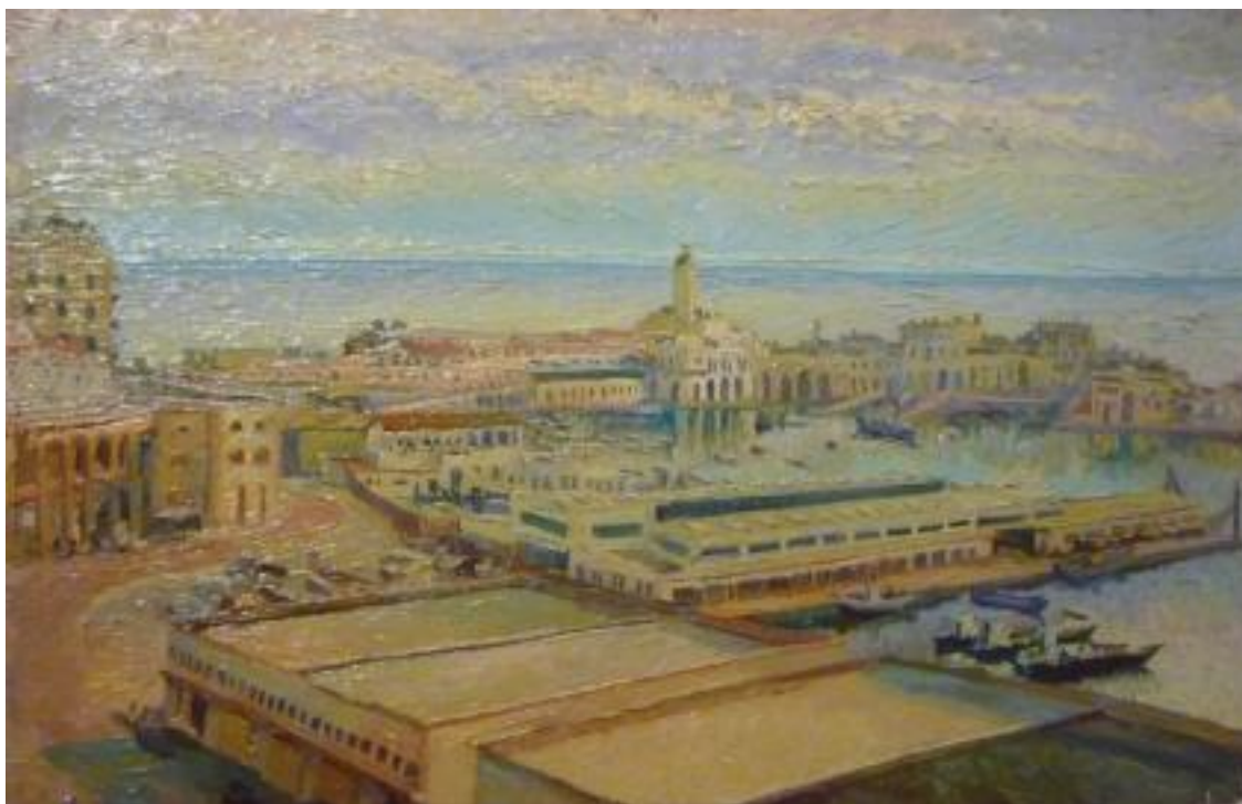
Henry Valensi , « Alger, le port », 1912, Coll. privée

plein coeur de la ville de Montbéliard. (1) Un édifice sans cesse transformé au fil des siècles, de la forteresse médiévale du Xe siècle au corps principal reconstruit au XVIIIe. En 1960 le château est devenu un musée regroupant d'importantes collections – archéologie, histoire naturelle et beaux-arts – auxquelles est venue s'ajouter à partir de 1970 une collection d'art contemporain. Des expositions temporaires sont régulièrement organisées.