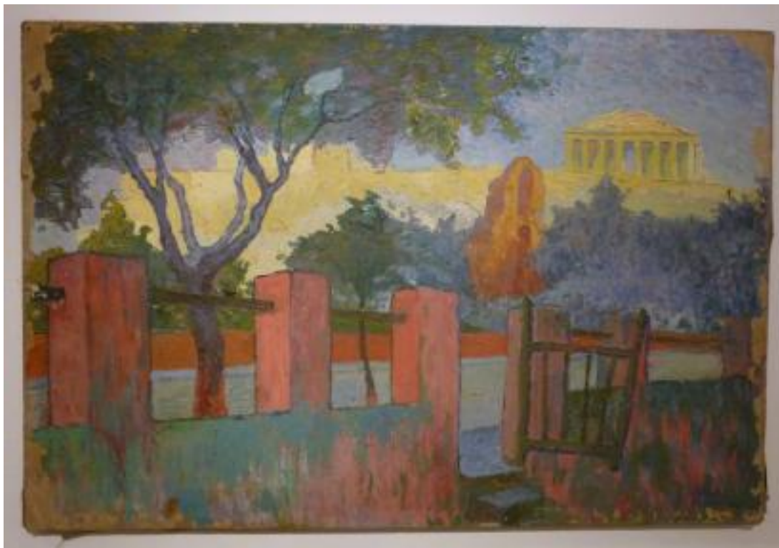
Henry Valensi, « Athènes », 1909, Coll. privée

Le choix d'un parcours chronologique s'imposait pour un artiste qui est aussi un théoricien et dont la création évolue en fonction de recherches axées sur le lien entre la science et l'art. D'où l'organisation de l'exposition en quatre sections qui, de 1909 à 1960, correspondent aux principales étapes de sa vie et de sa réflexion, jalonnées de beaucoup de mots en « isme », (orientalisme, impressionnisme, expressionnisme, rayonnisme, futurisme, musicalisme) et d'œuvres emblématiques.