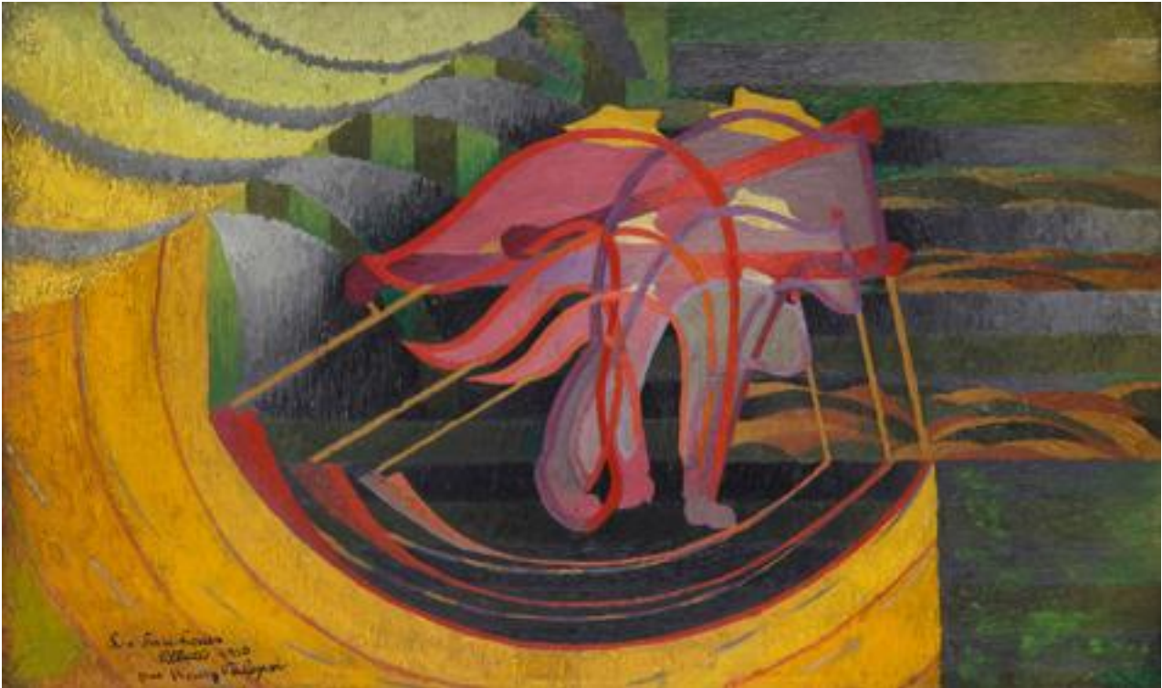
Henry Valensi, « Les faucheurs », 1910, Courtesy Galerie Le Minotaure © ADAGP – Paris, 2017