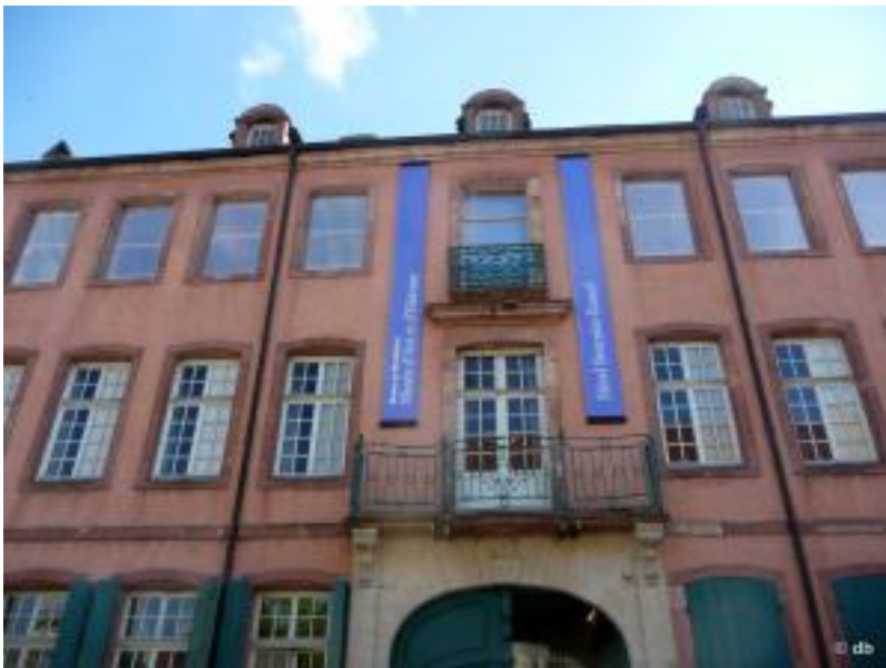
Montbéliard, Hôtel Beurnier-Rossel