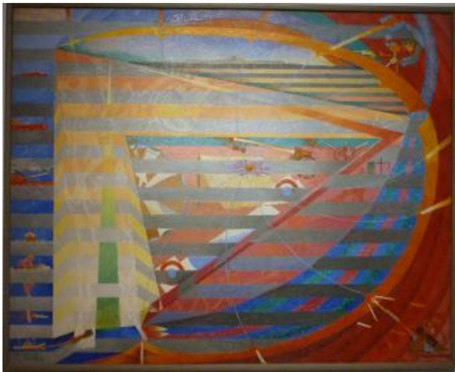
Henry Valensi , « Expression des dardanelles », 1917

La guerre marque un tournant. Affecté par la disparition de son frère Raoul, mort en vol au début du conflit, Henry Valensi décide de s'engager comme volontaire. C'est en tant que peintre des Armées qu'il documente pendant plusieurs mois la campagne des Dardanelles. Il en rapporte plus de deux cents oeuvres qui font l'objet d'une exposition en 1917. L'Expression des Dardanelles , synthétise cette expérience, avec une toile entre figuration et abstraction organisée autour d'un motif central en forme de « D ».