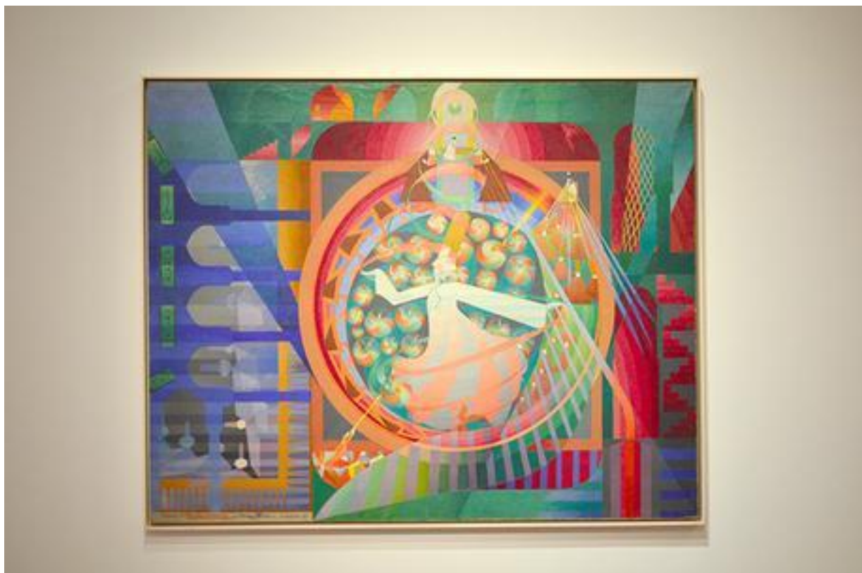
Les Derviches tourneurs, Henry Valensi , 1922

Infos pratiques : Exposition du 15 avril au 17 septembre 2017 De 10h à 12h et de 14h à 18h Fermé le mardi et les jours fériés Entrée : 5 euros / Tarif groupes et étudiants : 3 euros. Entrée gratuite pour les moins de 18 ans, les personnes handicapées, ainsi que le 1er dimanche de chaque mois. Encore plus d'infos sur http://www.montbeliard.fr/